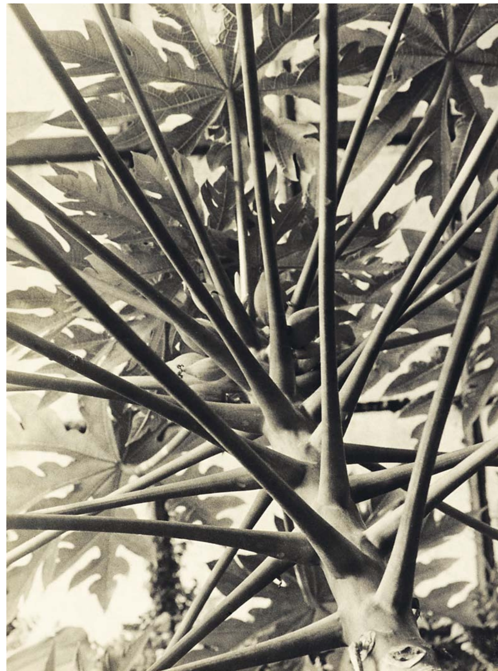
LVR-LandesMuseum / Archiv Ann und Jürgen Wilde / VG Bild-Kunst, 2019